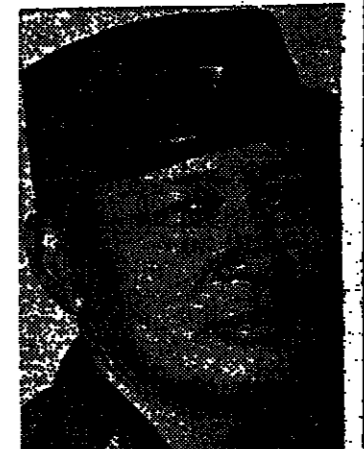
سوهايو حيز لسف الأريزي

جكرتا - رويتر - حذر الرئيس الأندونيسي سوهارنو من أن حزب الشيوعيين قد يسيطر على البلاد في ظل غياب مستر مع رئيس الأركان كمال تورال السني في تنظيمه.